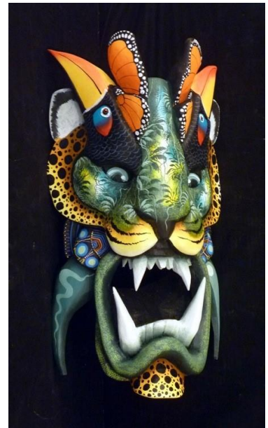
Imagen 4. Máscara Boruca del artista Kamel González.