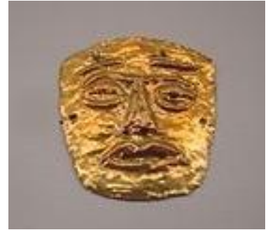
Imagen 3. Máscara ritual indígena de Costa Rica. Confecciona en oro.

d-Las caretas: se sujetan con una liga o elástico.