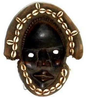
Imagen 1. Máscara ritual Yoruba, África.